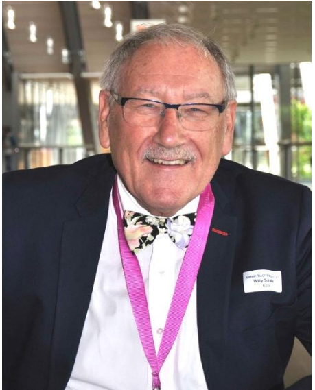
Autor: Willy Schäfer

Über 200 Personen feierten am 6. Juni 2017 im Zentrum Paul Klee die Vernissage des Buches "Wittigkofen – Landschaft, Schloss und Umgebung" von Willy Schäfer. Gönnerinnen und Gönner, die mit ihren grösseren und kleineren Spenden ermöglicht hatten, dass das Buch gedruckt werden konnte, Unterstützer und Gäste des Autors freuten sich über das gediegene und "gewichtige" Werk, ein Exemplar wiegt über ein Kilo. Papier- und Bildqualität und ein sorgfältiger Druck sind der erste Eindruck, wenn man das Buch in die Hand nimmt.