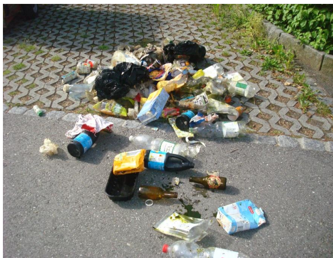
Inhalt eines illegal deponierten Kehrachtsackes in Wittigkofen

Gemäss www.Welt.de verbauen Singvögel Zellulose von Zigarettenstummeln in ihren Nestern und halten so Parasiten fern: das Nikotin ist ein wirksames Insektizid!